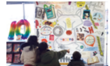
Mur d'énigmes géant, le défi du lecteur : 50 énigmes à décoder. Il a fallu se creuser la tête ...