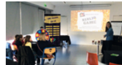
Biblio'game : animation inspirée des jeux télé réadaptée au monde des livres et des bibliothèques

Lors de la semaine anniversaire qui s'est déroulée du 11 au 18 mars, petits et grands ont pu participer aux différentes animations proposées par la Médiathèque.