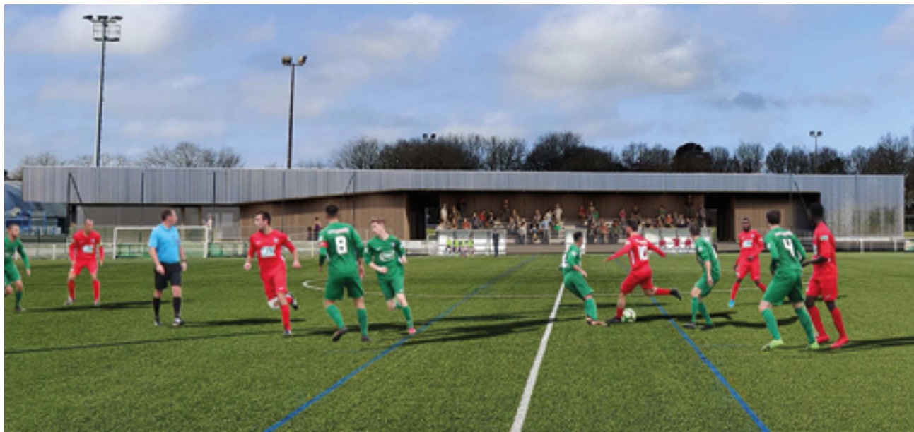
Esquisse du projet

La commune a missionné le cabinet d'architectes SET pour la construction de nouveaux vestiaires de football et l'aménagement des espaces extérieurs des Frénoelles.